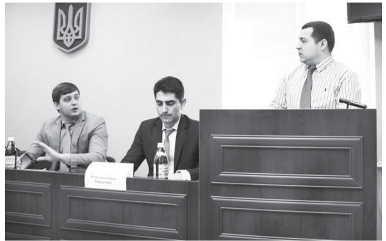
Фотос: В. Шилов

Крім того, значним чином впливає на рівень розкриття злочинів ухвалення слідчими неправомірних рішень про закриття кримінальних проваджень, у 2014 р. таких скасовано 143 незаконні постанови.