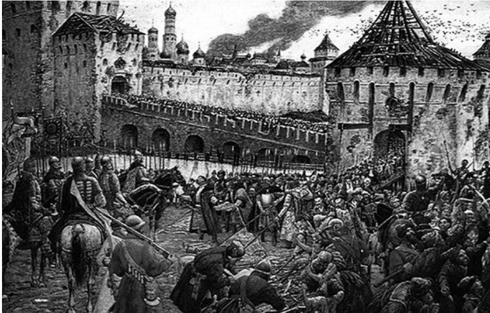
9 березня 1617 р. підписаний Столбовський мирний договір між Україною і Швецією

Про українські землі, а саме про історію і географічні межі, повідав світу краківський канонік Матвій Меховський у дослідженні «Трактат про дві Сарматії». У цьому році помирають дві визначні