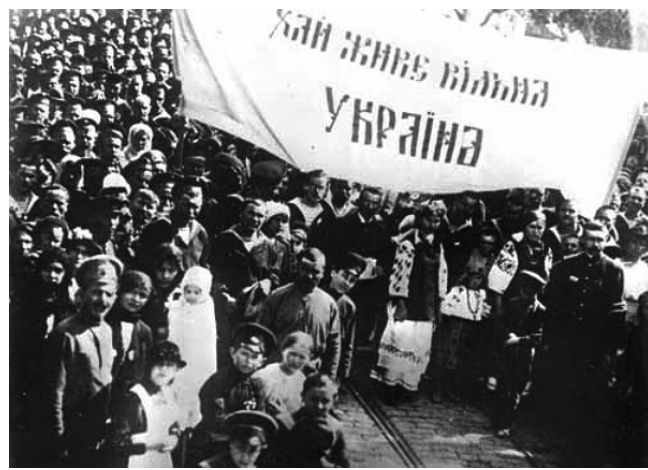
Українська революція 1917 – 1921 рр.

Рік остаточного знищення козацтва, коли Бузьке козацьке військо було перетворе-