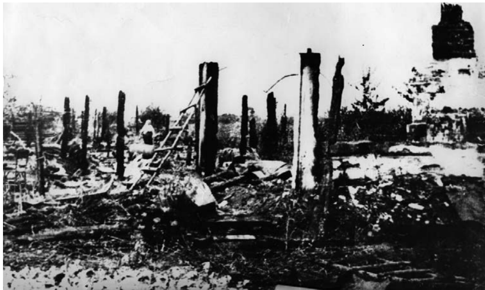
Згарища Корюківки. 1947 рік

– Жалюві випробування випали на долю мого майбутнього чоловіка, – продовжує розповідь моя візаві. – Холод, голод, людські смерті... Майже вся війна – в полоні, потім визволення, фільтрація,