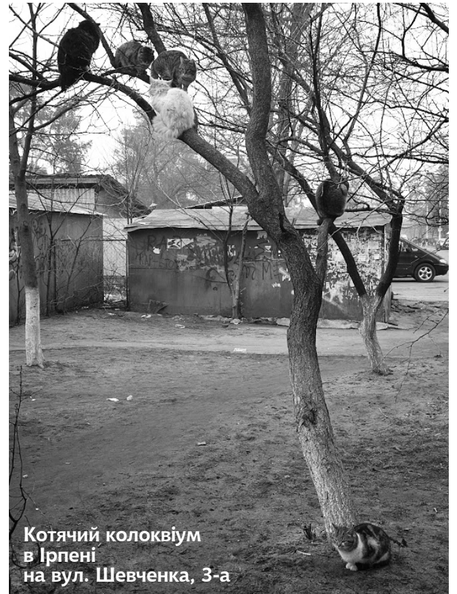
Котячий колоквиум в Ірпені на вул. Шевченка, 3-а

Експерти також радять грати з кішкою не менше