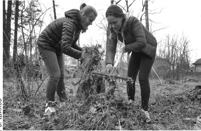
На толоку вийшли всі, незважаючи на вік, статус і посаду

стоту. Тому цьогорічна акція стала однією із найчисельніших. У ній взяли участь близько 300 осіб, зокрема, представники депутатського корпусу міської ради, виконавчого комітету та апарату Ірпінської міської ради, комунальних закладів, громад-