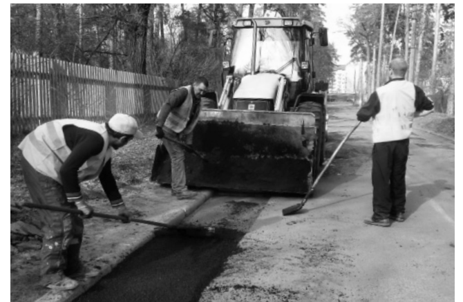
Ямковий ремонт у Ворзелі на вул. Стражеска

Сесія замінила слово «технік з благоустрою» на слово «інспектор з благоустрою», який тепер наділений повноваженнями складати припи-