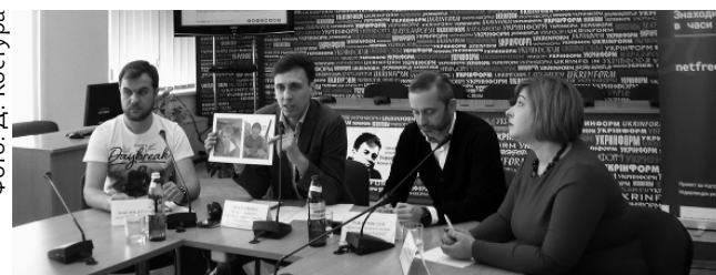
Учасники експертної дискусії «Що суспільству варто знати про безпеку в Інтернеті?»

Психолог радить батькам бути своїй дитині товаришем, другом, дорослим партнером, але в жодному разі не використовувати довіру дитини задля диктату. Батьки повинні контролювати, відстежувати, захищати, але не повчати, інакше дитина просто відсторониться».