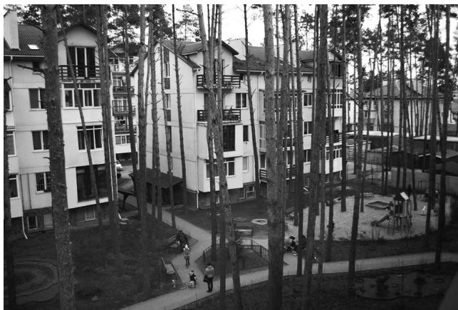
Двір в Ірпені на вулиці Єрошенка (раніше Островського) 12-В, за яким дбає ОСББ

«Найскладніше завдання – переконати людей у необхідності відмовитися від