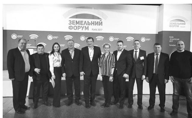
Представники Аграрної партії – учасники Земельного форуму

У свою чергу керівник Переяслав-Хмельницької