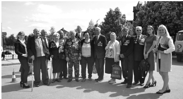
Юрій Бойко: «Ми повертаємо пам'ять про героїв, яких сьогодні влада всіляко намагається забути, переписуючи історію нашої країни»

Напередодні Дня Великої Перемоги, 8 травня, відбулася урочиста церемонія з нагоди перепоховання 110 загиблих червоноармійців, 18 з яких – ідентифіковано. Понад 600 учасників мітингу, і передусім – ветеранів та дітей війни, зібралися в Гатному, щоб провести в останню путь солдатів, що за-