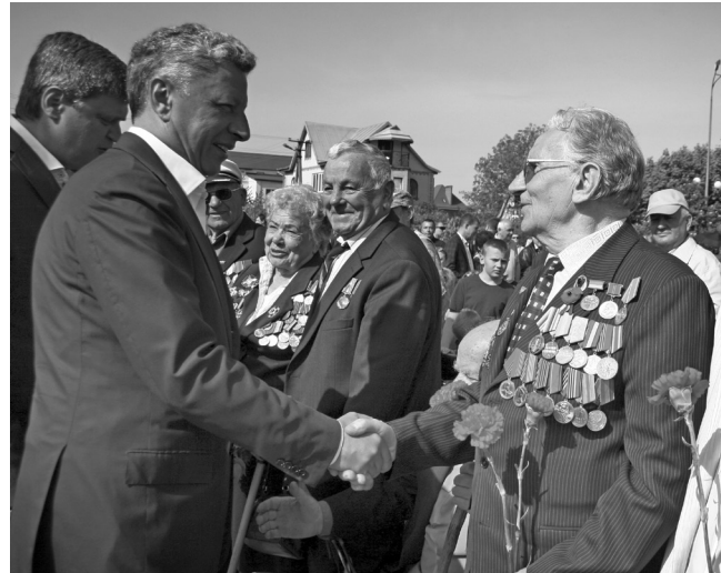
Ветерани з м. Ірпінь приїхали вшанувати пам'ять полеглих бійців

«Ми усвідомлюємо, наскільки високу відповідальність несемо як перед ветеранами, так і перед нашими нащадками у збереженні вітчизняної історії. Пошуковці роблять украй велику справу, за що їм щира подяка, – зазначив Олександр Качний. – Ми нікому не дозволимо знівелювати пам'ять про цю страшну війну. І для наших