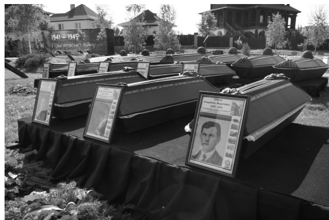
Пошуки бійців триватимуть, доки не буде похований останній солдат