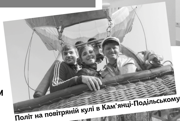
Політ на повітряній кулі в Кам'янці-Подільському