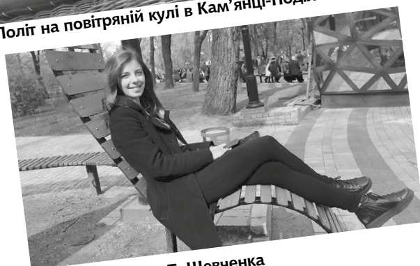
Київ, у парку ім. Т. Шевченка