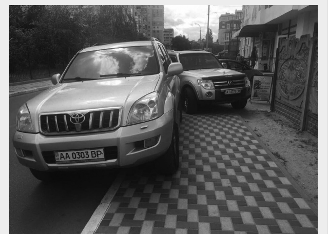
КОРОЛІ ПАРКУВАННЯ. Ірпінь, вул. Грибоєдова.