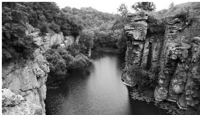
Парк «Гранітно-степове Побужжя»

Найбільш розвинений пункт – місто Первомайськ. Тут є автовокзал, міська залізниця, низка готелів і кафе,