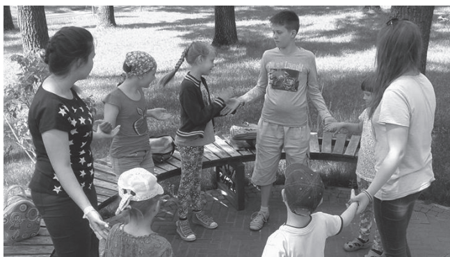
«Веселі вихідні з Богом»

За два роки в Ірпені облаштовано 16 зелених зон. Реконструйовано парки ім. Правика і «Дубки», створено парки «Центральний» і «Покровський». Відкрито сквер ім. Сидорука, сквери «Миру», «Дитячий», «Пушкінський». Це чудова територія для безкоштовних літніх прогулянок і занять спортом.