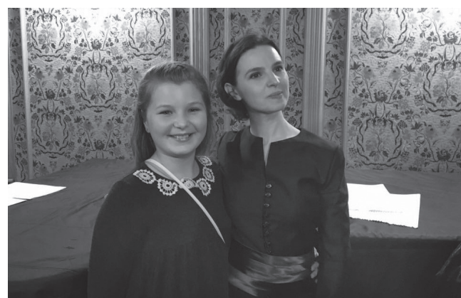
З диригенткою Оксаною Линів

– Участь у такого рівня Фестивалів – це не тільки величезний досвід, це, безумовно, величезна відповідальність і радість – у такому юному віці представляти себе й Україну на Міжнародній арені класичної музики. Кожен фестиваль має індивідуальний формат.