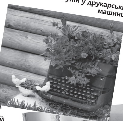
Кашпо для петуній у Арукарській машинці

Краще для основи вибрати нейтральний колір: чорний, коричневий або білий. Втім, якщо відомо, де річ стоятиме і що її оточуватиме, варто пофарбувати відповідним кольором.