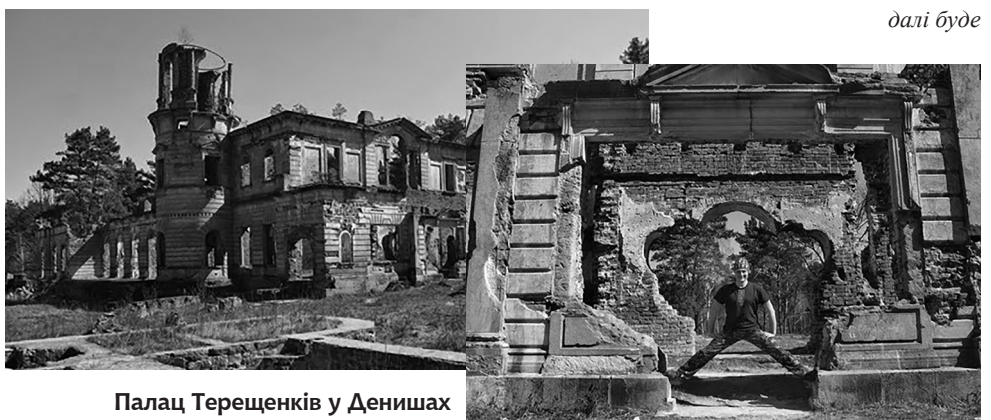
Палац Терещенків у Денишах