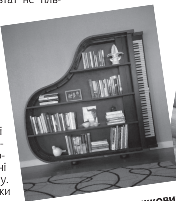
Рояль як книжковий стелаж

* Покрити виріб ґрунтовкою і зати – фарбою-основною, обов'язково – вздовж волокон деревини.