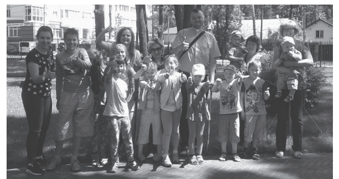
«Веселі вихідні з Богом»

Поталанило цього року Ірпінській ЗОШ №18, бо в її мовному таборі в період з 5