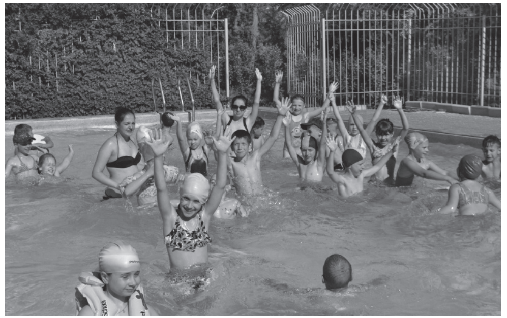
м. Скадовськ «Бригантина»

Контролюйте глобальні речі, залишаючи свободу вибору в деталях. Якщо дитина певний час перебуває вдома сама – проведіть розмову про безпеку від вогню, елек-