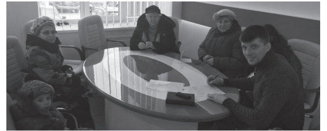
Мешканці Ірпеня на особистому прийомі