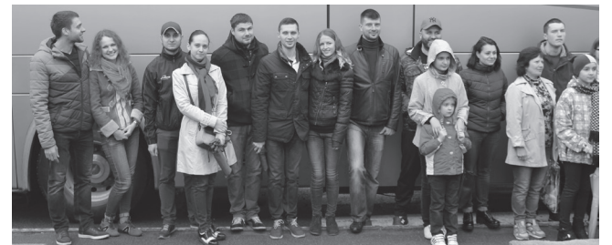
Організація поїздки мешканців Ірпеня на щорічний фестиваль польської культури