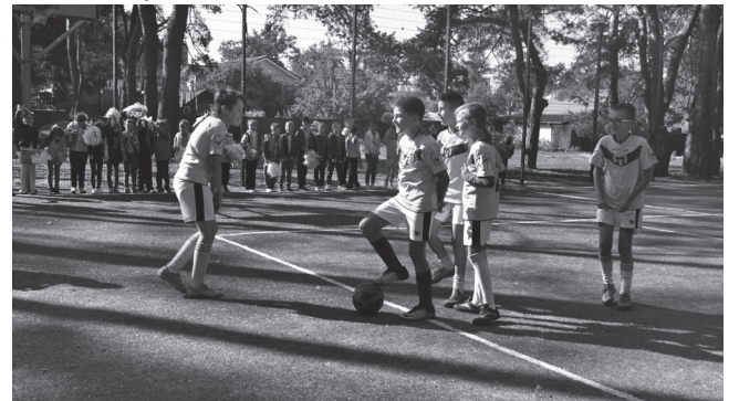
Спортивний майданчик школи №1

– багаторазовий переможець змагань різних рівнів з авіа-модельного спорту; у 2017 році на чемпіонаті Європи серед юніорів та дорослих у командному заліку він завоював перше місце, а в особистому – третє. Саме цим титулованим учням-спортсменам було надано право урочисто перерізати символічну стрічку.