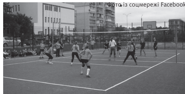
Спортивний майданчик школи №12