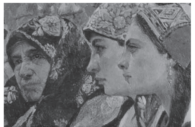
«Три віки» (1913)