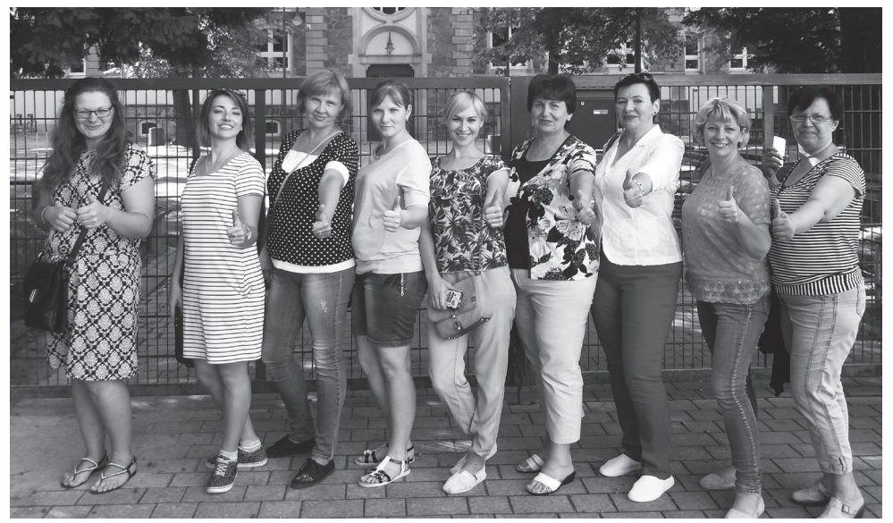
Ірпінські педагоги у вищій школі м. Борна - DINTERSCHULE

Звичайно, для наших учителів було справжнім дивом бачити окремий корпус школи, призначений лише для