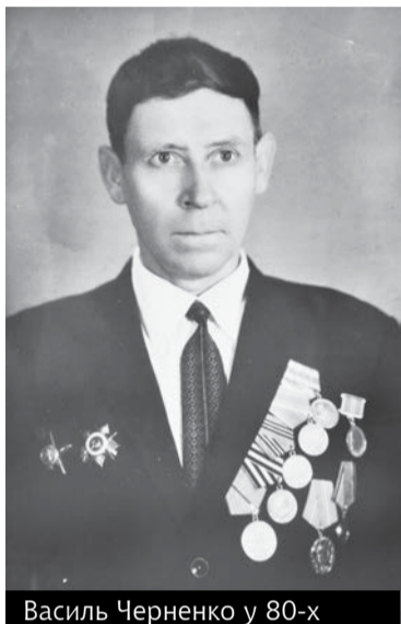
Василь Черненко у 80-х

На думку спадають інші афоризми: «Той, хто не пам'ятає свого минулого, приречений на те, щоб пережити його знову» (Джорж Сантаяна). «Єдиний скарб людини — це його пам'ять. Лише в ній — його багатство або бідність». (Адам Сміт).