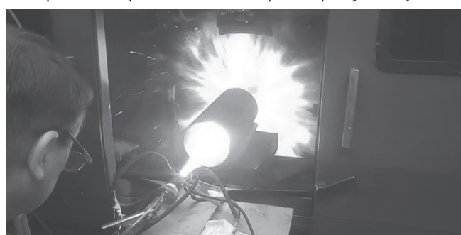
Плазмотрон у дії