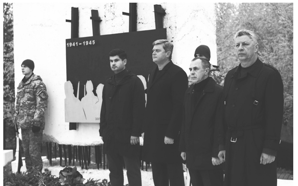
Лідер «Опозиційного блоку» Юрій Бойко, командир АППО «Дніпро-Україна» Сергій Распашнюк і депутат Київської обласної ради, голова «Опозиційного блоку» Київщини Олександр Качний на церемонії вшанування пам'яті полеглих бійців

Виступаючи на урочистому мітингу, народний депутат Юрій Бойко висловив