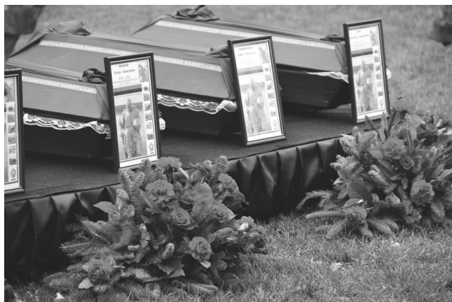
58 захисників було передано рідній землі. Пошуки інших загиблих тривають