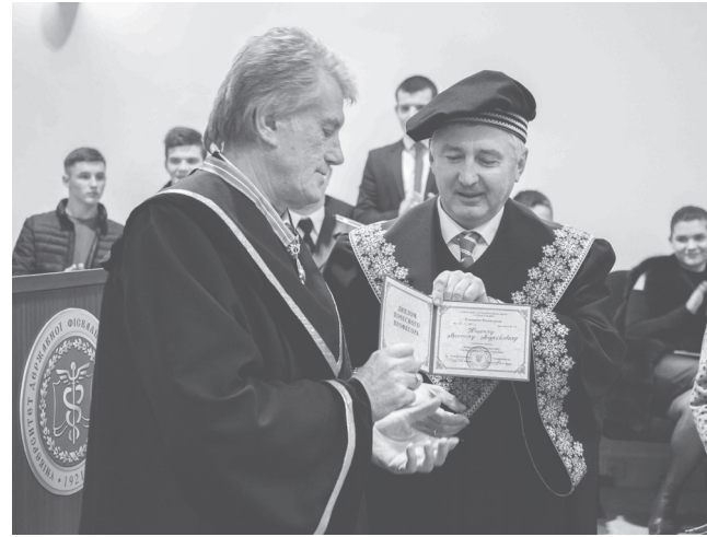
На фото: Віктор Ющенко та Павло Пашко

Під час зустрічі політик зосередив увагу студентів і курсантів на проблемах культури, національної свідомості, єдності та іміджу України у світі. «Ми маємо жити однією думкою, бачити одну ціль, формувати єдину синергію. Національна єдність виникає з мови. Мова – це суть національної ідентичності. В кожній європейській нації є своя державна мова. Україна починається з тебе! Будьмо