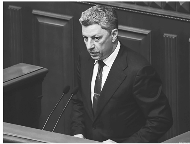
Юрій Бойко: Фракція «Опозиційного блоку» не буде підтримувати урядовий варіант Закону про бюджет