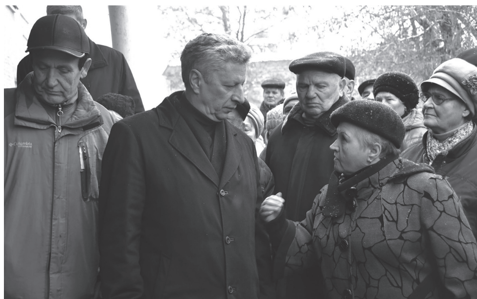
Юрій Бойко: Додавши пенсіонерам 200–300 гривень в якості «осучаснення» їхніх пенсій, влада відбрала у них 300–500 гривень субсидій

За словами лідера «Опозиційного блоку», народного депутата Юрія Бойка, ситуацію, коли українці масово зубожіють і не можуть оплачувати рахунки за послуги ЖКГ, спровокувала нинішня влада.