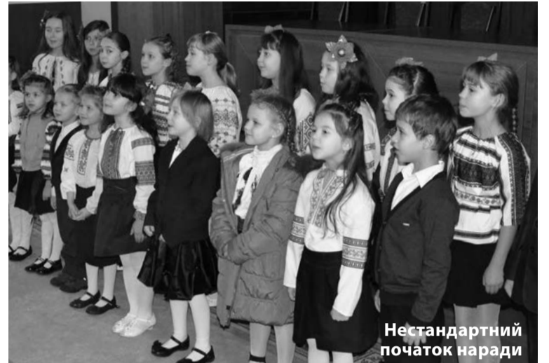
Нестандартний початок наради

Загалом робитимемо так, щоб підприємства функціонували не заради свого функціонування, а заради надання кінцевої якісної послуги. Керівники різних рівнів мають бути до того готові, чекаємо пропозицій. Потрібно розуміти: якщо ми цього оперативного не зробимо самі, нас усе одно