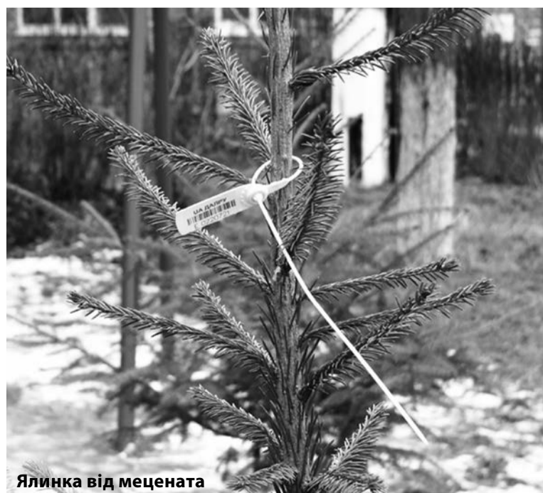
Ялинка від мецената

Валентин СОБЧУК