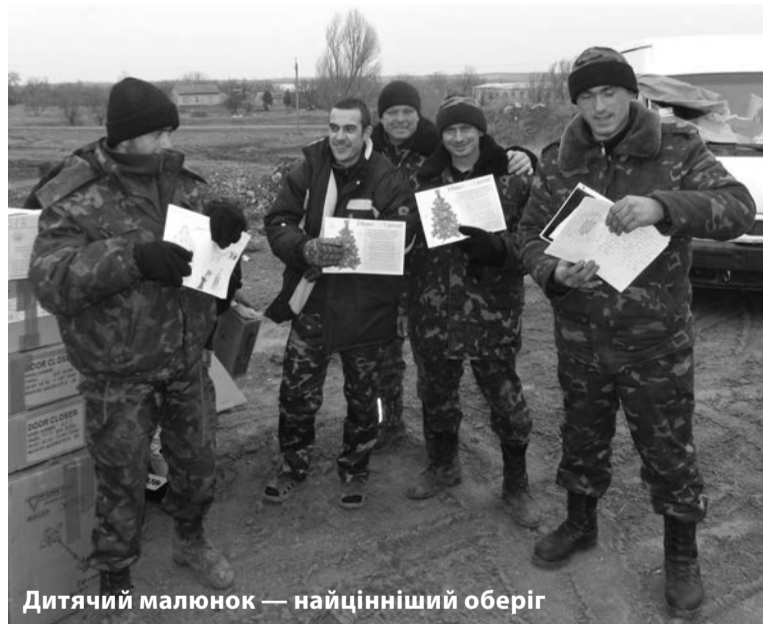
Дитячий малюнок — найцінніший оберіг

На прощання бійці привезли нам використані ворожі снаряди із систем залпового вогню