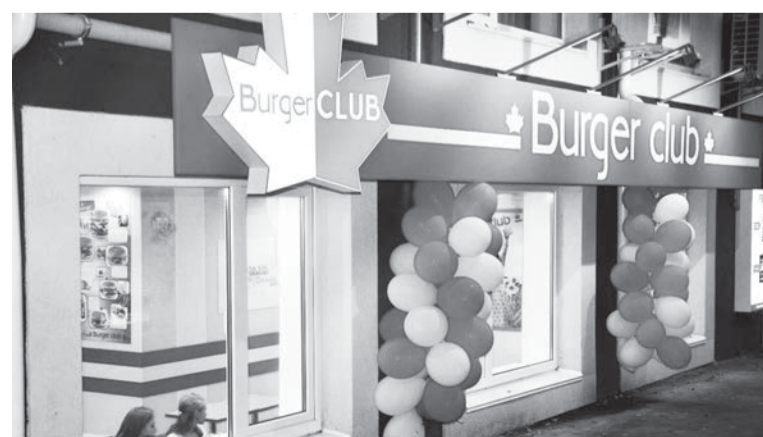
м. Ірпінь, вул. Університетська 33-А