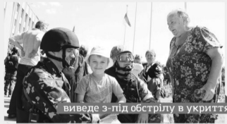
виведе з-під обстрілу в укриття