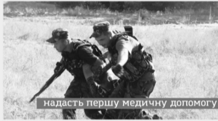
надасть першу медичну допомогу