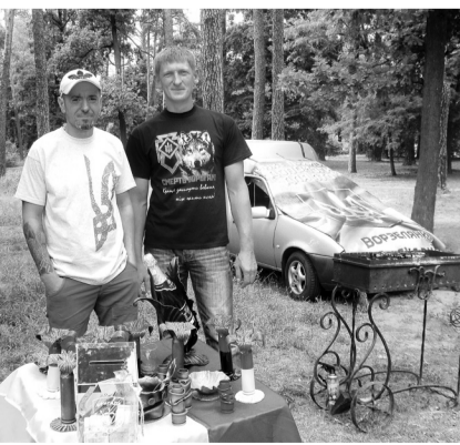
Було зібрано близько 2000 грн., вони підуть на потреби бійців-ворзелян, які воюють в АТО.