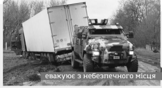
евакуує з небезпечного місця