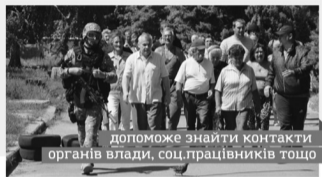
допоможе знайти контакти органів влади, соц. працівників тощо