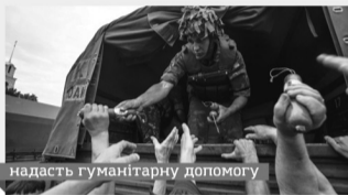
надасть гуманітарну допомогу