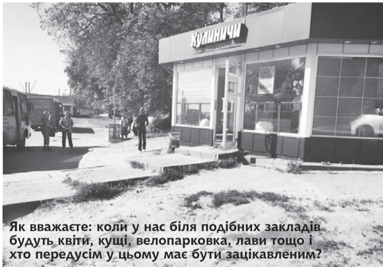
Як вважаєте: коли у нас біля подібних закладів будуть квіти, кущі, велопарковка, лави тощо і хто передусім у цьому має бути зацікавленим?

Шапки, які знайома приміряла, їй цілком підійшли (кожна з них коштувала по 250 грн.), однак вона вирішила поміряти ще одну. Скривившись від цигаркового диму, жінка попросила не курити так близько. У відповідь прозвучало епохальне: «Не подобається — купуйте в іншому місці». КЛІЄНТКА МОВЧКИ ЗАЛИШИЛА ТОВАР І НЕВДАХА-ПРОДАВЕЦЬ ЗА 5 ХВИЛИН СВОГО ПЕРЕКУРУ ВТРАТИЛА 500 ГРН. Ставши свідком цієї історії, я головні убори теж купувала в іншому місці, хоча тут був і вибір широкій, і локація зручна. Принципово. Тож нехай приплюсує ще стільки ж. Упевнена, що ми — не одні такі клієнти у цієї дамочки.