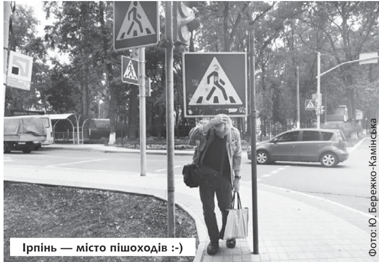
Ірпінь — місто пішоходів :-)

Звертатися до Анатолія Віталійовича. Тел.: 067-209-30-21.