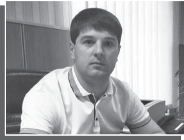
(початок — с. 1)

Прояснити ситуацію взявся «Ірпінський вісник», тим більше, що люди почали активно телефонувати до редакції.