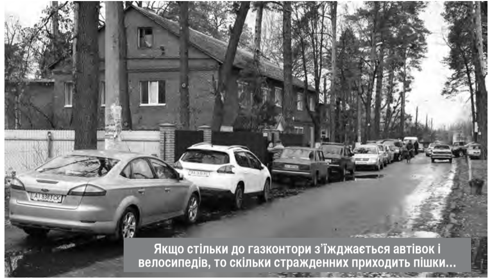
Якщо стільки до газконтори з'їжджається автовок і велосипедів, то скільки страждених приходиться пішки...

— А не йдіть до нас переоформлювати договір!