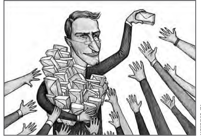
Іл. І. С. С. С. С.

Основними завданнями робочої групи є донесення до керівників підприємств важливості використання найманого працівника відповідно до вимог чинного трудового законодавства, проведення інформаційно-роз'яснюваль-