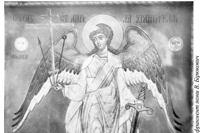
фрагмент ікони В. Бірюкович

Веде закрите життя через проблеми зі здоров'ям. До