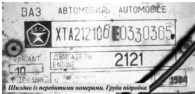
Шилдик із перебитими номерами. Груба підробка

«На жаль, ще не поодинокі випадки, коли покупець вірить на слово «продавцю», не зробивши елементарної перевірки. Якщо на кузові автомобіля відсутня номер-