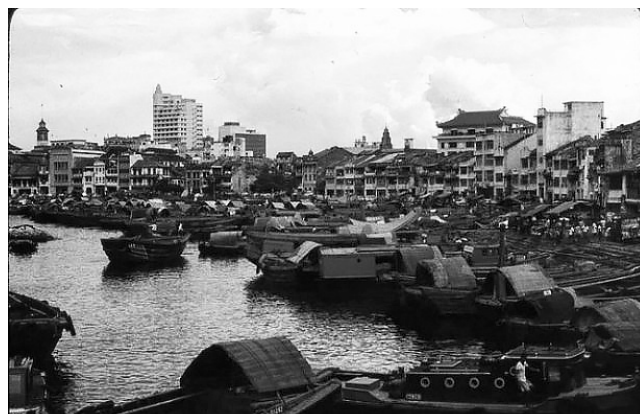
Сінгапур колись і зараз

1824 р. острів перейшов у власність Ост-Індської ком-