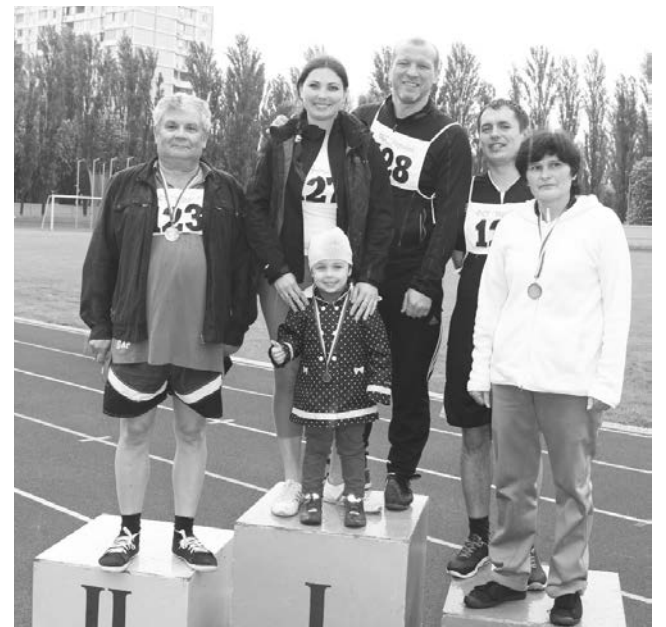
Збірна м. Ірпеня та Бучі, нагородження учасників

Бажаємо високих досягнень та перемог нашим спортсменам!