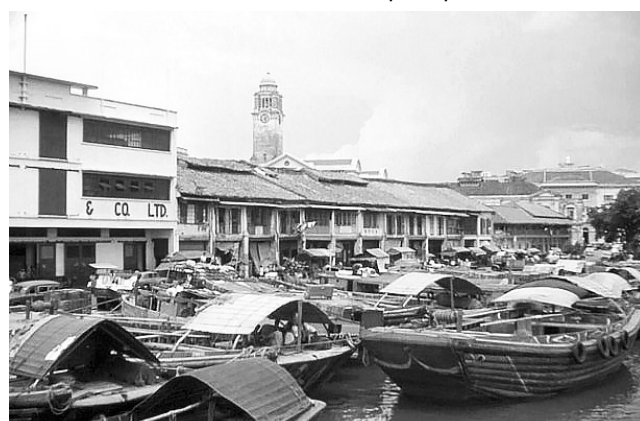
Сінгапур колись і зараз

Легковик західного виробництва, який в Україні, скажи-