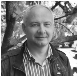
(початок — с. 1)

Нагадаємо, площа лісів в Україні – понад 10 млн. га, що становить 17,2% її території. Найбільша лісистість – в Українських Карпатах (32%). Лісистість у природних зонах рівнинної частини закономерно зменшується з півночі на південь. У лісах переважають молоді й середньовікові дерева таких порід, як сосна, ялина, бук, дуб. Вони охоплюють близько 90% лісовкритої площі. Близько половини лісів України є штучно створеними і потребують посиленого догляду.