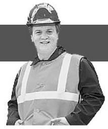
Суше прибирання вулиць міста по днях тижня.

Прибирання парків – щодня; Прибирання майданчиків і вулиць центру міста – щодня; Прибирання автозупинок – тричі на тиждень – 32 зупинки;