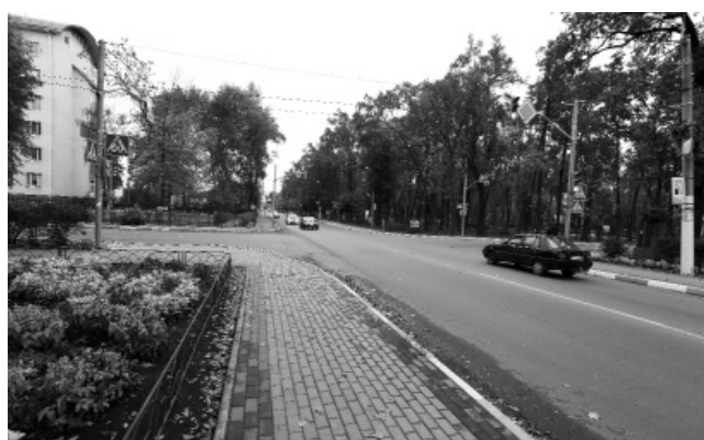
Вулиця Соборна сьогодні

У 1943-му його разом із дружиною заарештували і засудили до каторжних робіт на шахтах системи ГУЛАГ. Після звільнення у 1953 р. і реабілітації у 1962 р. Г. Кочур повернувся в Україну й оселився разом із дружиною та сином в Ірпені, де мешкав упродовж 32 років, до самої смерті. У їхній домі збиралася опозиційно налаштована творча інтелігенція. У цьому «ірпінському університеті» бували В.