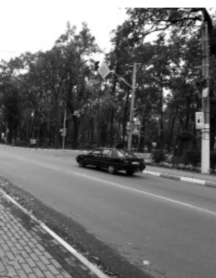
Вулиця Попова сьогодні