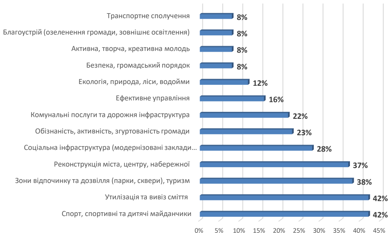
Рисунок 1.Що подобається в громаді?